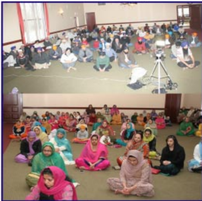
ਗੁਰਦੁਆਰਾ ਗੁਰੂ ਨਾਨਕ ਸੋਸਾਇਟੀ Hamilton, Ohio ਵਿਖੇ ਕੀਰਤਨ ਵਿੱਚ ਜੁੱਤੀਆਂ ਸੰਗਤਾਂ ਦੇ ਦ੍ਰਿਸ਼।