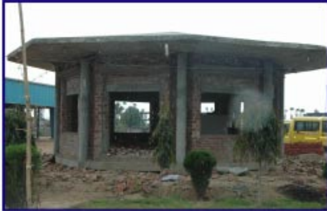
ਉਸਾਰੀ ਅਧੀਨ ਮਾਤਾ ਜੀ ਦੇ ਯਾਦਗਾਰੀ ਭਵਨ

ਹਾਂ ਉਥੇ ਜਾ ਕੇ, ਮੈਂ ਨਹੀਂ ਜਾਣਾ। ਜਿੰਨੇ ਸਿੰਘ ਨੇ ਅਸਥਾਨ ਦੇ, ਸੰਗਤ ਨੂੰ ਪਤਾ ਹੈ, ਕਿੰਨਾ ਚਿਰ ਨਹੀਂ ਆਏ, ਵੇਰਾਗ ਵਿਚ ਰਹੇ। ਜਿਹੜੀ ਸ਼ਾਇਦ ਸਾਨੂੰ ਗੱਲਾਂ ਯਾਦ ਵੀ ਨਹੀਂ। ਕਹਿੰਦੇ, ਅਸੀਂ ਨਹੀਂ ਜਾ ਕੇ ਉਥੇ ਬਹਿਣਾ, ਤੁਹਾਡੇ ਪਿਤਾ ਜੀ ਚੜ੍ਹਾਈ ਕਰ ਗਏ ਨੇ, ਮੈਨੂੰ ਇਸੇ ਤਰ੍ਹਾਂ ਬੈਠੇ ਰਹਿਣ ਦਿਓ। ਕਿੰਨਾ ਪਿਆਰ 'ਤੇ ਵੇਰਾਗ ਤੇ ਯਾਦ ਆਉਂਦਾ ਹੈ। ਧੰਨ ਮਾਤਾ ਸਾਹਿਬ ਕੌਰ ਤੇ ਧੰਨ ਮਾਤਾ ਸਾਹਿਬ ਕੌਰ ਜੀ ਦੇ ਧੀਆਂ ਪੁੱਤਰ। ਸਾਡੇ ਤਾਂ ਉਹ ਮਾਤਾ ਜੀ ਨੇ। ਮਾਤਾ ਸਾਹਿਬ ਕੌਰ ਜੀ ਨੇ ਕਿੰਨਾ ਵੇਰਾਗ ਕੀਤਾ ਹੈ ਸ਼ਾਇਦ ਉਸ ਪਿਆਰ ਤੇ ਵੇਰਾਗ ਵਿਚੋਂ ਹੀ ਸਤਿਕਾਰਯੋਗ ਬੀਜੀ ਨੂੰ ਹੀ ਕਿੰਨਾ ਕੁਛ ਪ੍ਰਾਪਤ ਹੋਇਆ ਹੈ।