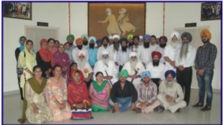
ਪੰਜਾਬੀ ਯੂਨੀਵਰਸਿਟੀ ਵਿਖੇ ਸ੍ਰੀ ਗੁਰੂ ਗ੍ਰੰਥ ਸਾਹਿਬ ਅਧਿਐਨ ਵਿਭਾਗ ਵਿੱਚ ਸੰਤ ਮਹਾਂਪੁਰਖ ਅਧਿਆਪਕਾਂ ਅਤੇ ਵਿਦਿਆਰਥੀਆਂ ਨਾਲ।