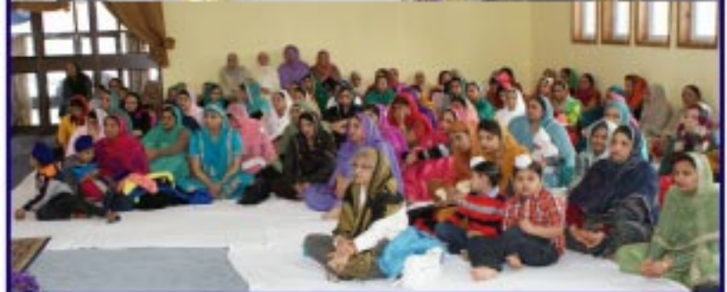
ਗੁਰਦੁਆਰਾ ਮਿਡਵੇਸਟ ਸਿੰਘ ਐਸੋਸੀਏਸ਼ਨ Shawnee, Kansas ਵਿਖੇ ਕੀਰਤਨ ਵਿੱਚ ਜੁਝੀਆਂ ਸੰਗਤਾਂ।