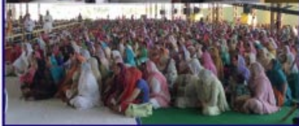
ਕੁਰਦੁਆਰਾ ਈਸ਼ਰ ਪ੍ਰਕਾਸ਼ ਵਰਿਅਮਸਰ ਅਸ਼ੋਕ ਨਗਰ ਮੱਧ ਪ੍ਰਦੇਸ਼ ਵਿਖੇ ਸਾਲਾਨਾ ਸਮਾਗਮ ਸਮੇਂ ਸੰਗਤਾਂ ਦਾ ਇੱਕ ਦ੍ਰਿਸ਼।