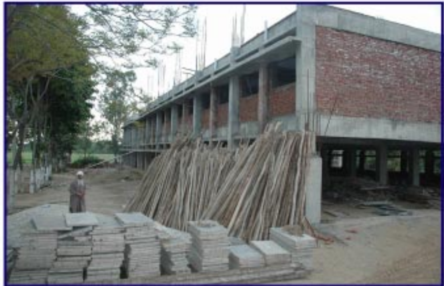
ਉਸਾਰੀ ਅਧੀਨ ਮਾਤਾ ਰਣਜੀਤ ਕੌਰ ਨਰਸਿੰਗ ਕਾਲਜ ਰਤਵਾਰਾ ਸਾਹਿਬ