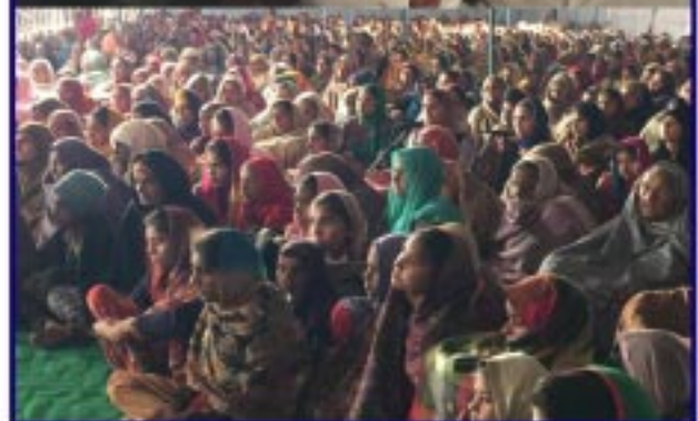
ਨਗਰ ਖੁਗਿਆਣਾ ਜਿਲ੍ਹਾ ਫਰੀਦਕੋਟ ਵਿਖੇ ਸੰਗਤਾਂ ਕੀਰਤਨ ਦਾ ਅਨੰਦ ਮਾਣਦੀਆਂ ਹੋਈਆਂ